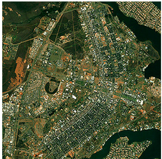
Foto dal satellite di Brasilia

La costruzione di Brasilia, città dall'aspetto straordinariamente moderno, venne intrapresa in una zona disabitata nel 1957 e portata a termine nel 1960 per sostituire nella funzione di capitale la periferica e ormai sovraffollata Rio de Janeiro. Da allora, la città si è sviluppata rapidamente, soprattutto per effetto dell'immigrazione dalle regioni più povere del paese.