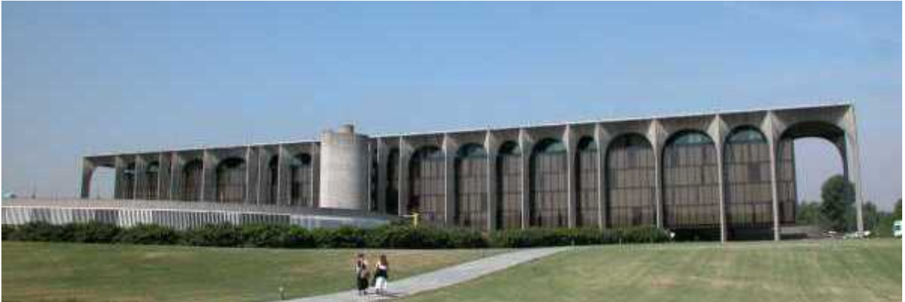
sede della Mondadori

Negli anni futuri troviamo l'Architetto impegnato in varie progettazioni in giro per il mondo. Infatti lo troviamo anche in Italia per la progettazione della sede della Mondadori (a Segrate, Milano 1976),