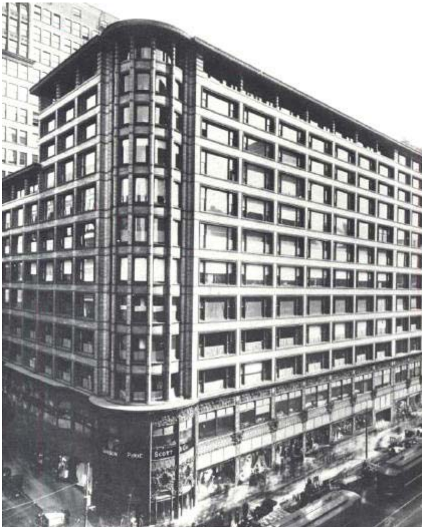
Magazzini Carson , Pirie e Scott , Chicago , 1899/1904 .

partenza del rinnovamento funzionalista è dato dall'edificio Wainwright di St. Louis costruito nel 1889 ... Chiude il secolo ed apre il nuovo il capolavoro dei Magazzini Carson , Pirie e Scott ... Quest'opera fa di Sullivan il profeta dell'architettura moderna .